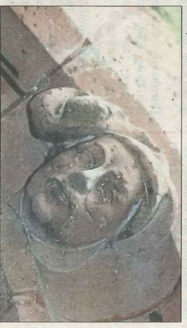
Am Eschenheimer Turm ist das Selbstporträt des Architekten und Bildhauers Madern Gerthener zu finden.

fortschrittsgläubige Bürgermeister überlebt und zeigen sich noch so schön wie vor 600 Jahren“, stellt die US-Amerikanerin Jodean Ator fest, die früher im amerikanischen Konsulat arbeitete. Sie bietet ihren neuen Rund-